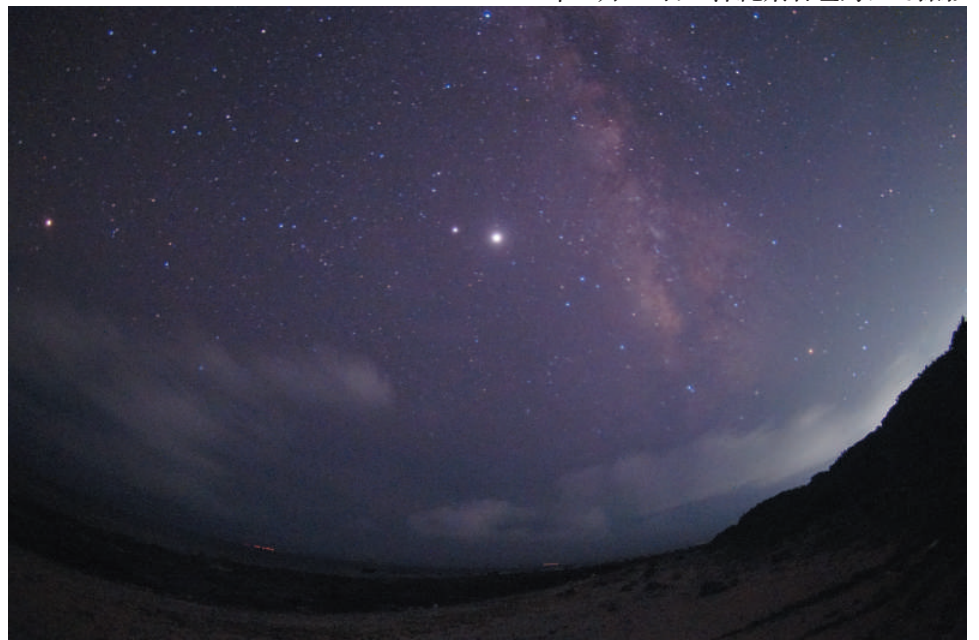
夏の天の川と火星・木星・土星 10mmF3.5 魚眼レンズ + APS-C カメラ 30秒露出 2020年6月23日 沖縄県石垣島にて撮影