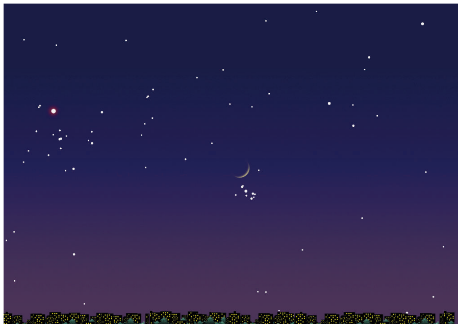
右画像：4月29日の日没後1時間後の西の空のシミュレーション