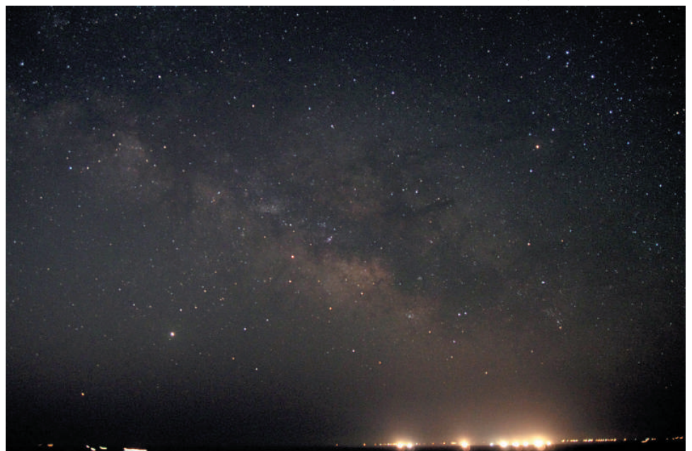
下写真： 海から昇るさそり座と夏の天の川・火星・木星・土星 20mmF1.7レンズ→F2.2 + APS-Cカメラ 15秒露出 2020年2月24日 千葉県勝浦市にて撮影

6月に入ると、これにさらに金星がも 加わり。夏の大三角などの明るい星たちと いっしょに明け方の空で饗宴するようにな ります。是非ちょっと早起きして、明け方 の惑星たちの動きを確かめてみてください。